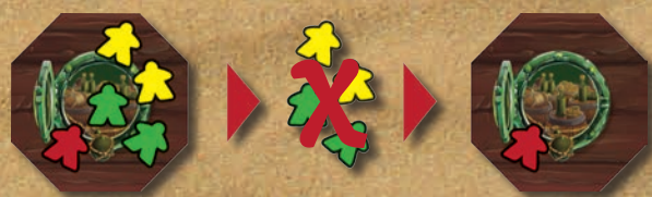
Exemple : ROUGE gagne la tuile à la faveur de l'égalité JAUNE-VERT

JAUNE a préalablement reçu 1 Doublon pour le pion Equipage qu'il n'a pas engagé dans le pillage.