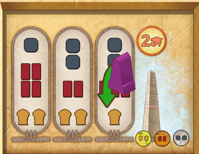
Figure 19 : Planifier un obélisque

Vous pouvez planifier plusieurs Monuments en parallèle, mais un seul Monument peut se trouver sur un même cartouche.