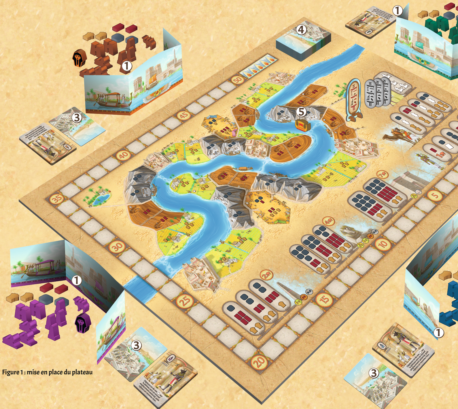
Figure 1 : mise en place du plateau

Le Gouverneur ayant le plus de Points de Gloire (PG) à la fin de la partie sera déclaré vainqueur et nouveau Pharaon. La Gloire peut être acquise en bâtissant des Monuments le long du Nil.