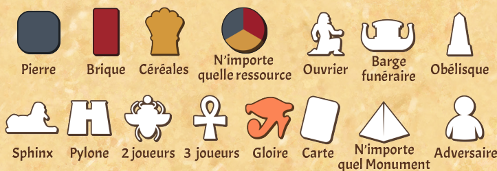
Figure 3 : légende des icônes