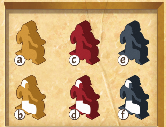
Figure 8 : Ouvriers

Chaque type d'Ouvrier ne peut travailler que sur un terrain particulier.