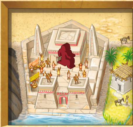
Figure 15 : Visite d'une Cité