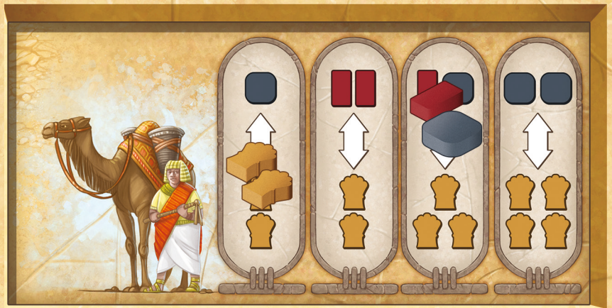
Figure 18 : Échange de ressources au Marché

Les ressources payées restent dans le Cartouche et empêchent un autre Gouverneur d'utiliser ce cartouche, pour le reste de la saison. Les ressources ne sont pas disponibles pour la Récolte et restent sur le cartouche jusqu'à la fin de la saison.