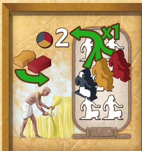
Figure 17 : Engager un Ouvrier