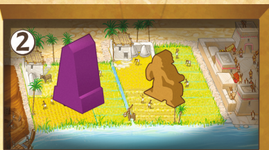
Figure 13 : Ouvrier et Monument

③ Si les deux sections sont occupées par des Monuments, l'Ouvrier ne pourra y être placé. Il faudra donc choisir un autre terrain où le placer.