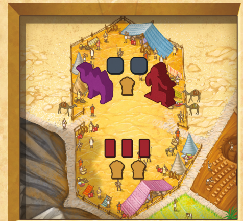
Figure 16 : Monter ou rejoindre une caravane

Chaque section ne peut accueillir qu'un seul Ouvrier ; et chaque emplacement de Caravane, un Chameau et deux Ouvriers.