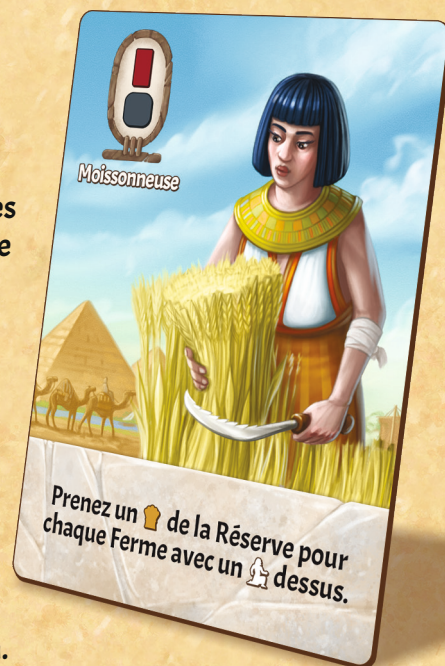
Figure 20 : Carte Cité

Une fois jouée, la carte Cité est défaussée. Une fois la pile de cartes Cité épuisée, mélangez la défausse et formez une nouvelle pile.