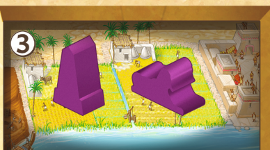
Figure 14 : Deux Monuments

Le nombre de ressources est limité. Les jetons présents dans le Marché (cf. Action 5) ou sur le Cartouche des Ouvriers (cf. Action 4) sont considérés comme déjà utilisés et donc non disponibles pour la saison en cours. Ainsi, si vous effectuez une action qui doit vous permettre de récupérer des ressources de la Réserve, mais qu'il n'y en a pas assez, vous ne récupérez que ce qui est disponible (il est donc parfois possible que vous ne puissiez rien récupérer du tout), et cela jusqu'à ce que la Réserve soit à nouveau réapprovisionnée.