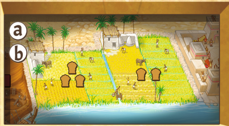
Figure 9 : Ferme

Chaque type d'Ouvrier ne peut travailler que sur un terrain particulier.