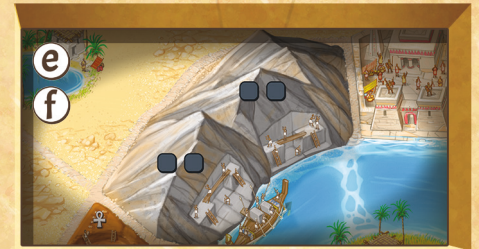
Figure 11 : Carrière de pierre

Les Ouvriers ne peuvent être placés que sur les terrains que la Barge Funéraire a longés (dont ceux qui bordent le segment du Nil où elle se trouve durant cette saison).