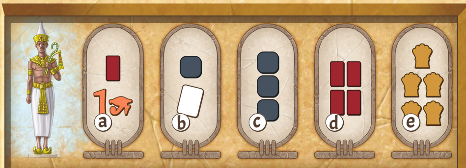
Figure 22 : Bonus pour le premier à se retirer

Lorsque les autres Gouverneurs se retirent, ils placent leur marqueur de retrait devant leur paravent, à la vue de tous.