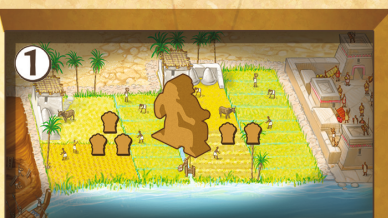
Figure 12 : Ouvrier occupant les deux sections

Pour récolter des ressources, placez un Ouvrier ou Contremaître sur le terrain approprié et prenez dans la Réserve le nombre de ressources indiqué par les icônes, puis placez-les derrière votre paravent.