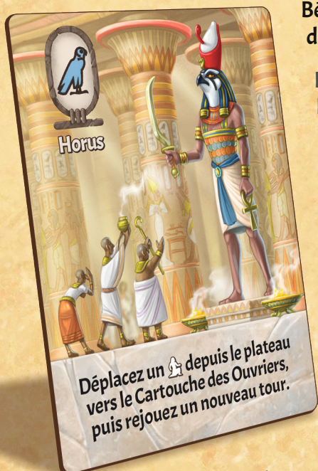
Figure 21 : Carte Bénédiction

A la fin de la saison, les cartes Bénédiction jouées sont retirées du jeu.