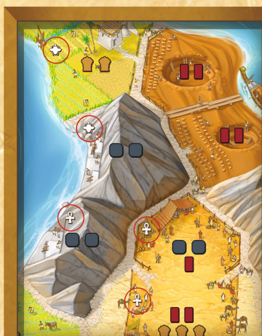
Figure 4 : Emplacements pour les mises en place spécifiques