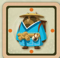
Le tanuki (sorte de raton-laveur). 1 autocollant recto