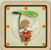
Le koropokkuru (lutin). Il est le maître des yōkai . 1 autocollant recto

Chaque joueur dispose de quatre types de yōkai – esprits de la forêt. Ils ont tous une face à points orange ; un seul peut se transformer et être retourné sur sa face à points bleus (le kodama ) :