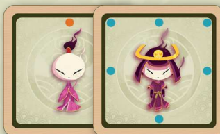
Le kodama (esprit de l'arbre). Il peut se transformer en kodama samurai . 2 autocollants recto verso

La position de départ des yōkai est telle qu'indiquée sur le dessin ci-contre. Ils sont tous positionnés en début de partie sur leur face à points orange . Un rappel est dessiné sur le bas du plateau.