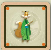
Le kitsune (renard). 1 autocollant recto